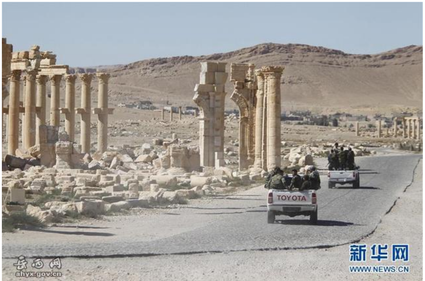
资料图：此前叙利亚政府军在巴尔米拉巡逻

此外，尽管叙利亚政府军集中兵力收复阿勒颇，战事却仍显焦灼；与此同时，有迹象表明极端武装开始转战政府军势力薄弱地区。